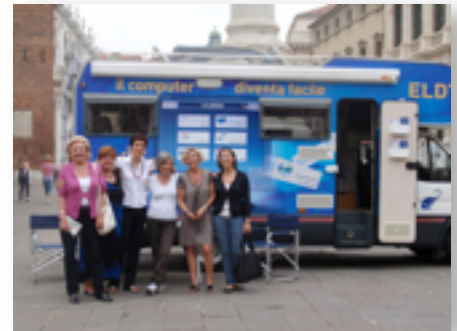
Eldy è per Mac, Linux, Windows

Internet per tutti non è un sogno, è la realtà che l'associazione Eldy immagina per una Italia moderna e al passo con i tempi.